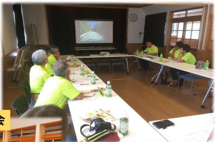
ドライブレコーダーの確認