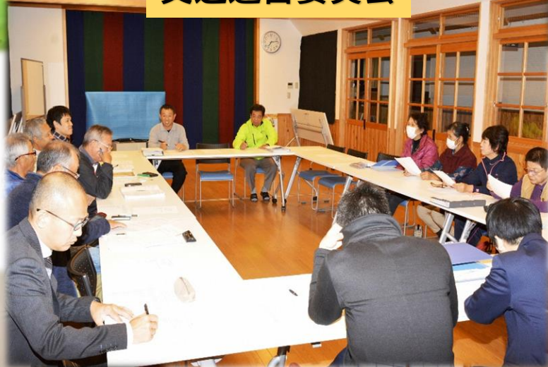
勉強会（ワークショップ）